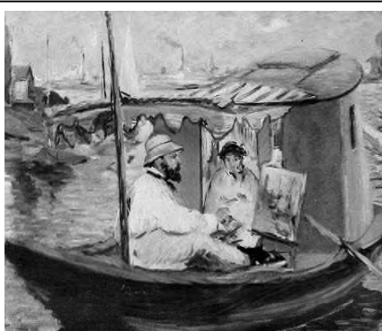
Monet et sa femme sur le bateau atelier Claude Monet, 1874