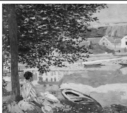
La Seine à Bennecourt Claude Monet, 1868